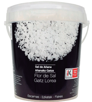
CUBO 500 GR.

estuche de 125 gr. - caja de 24 unidades estuche de 250 gr. - caja de 6 unidades