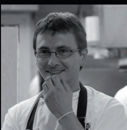
ANDONI LUIS ADURIZ