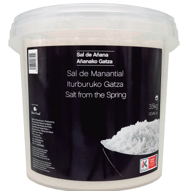
CUBO 3,5 KG.