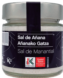
TARRO DE CRISTAL 200 GR.