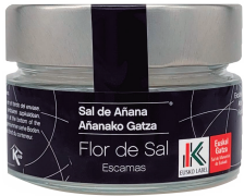
TARRO DE CRISTAL 70 GR.