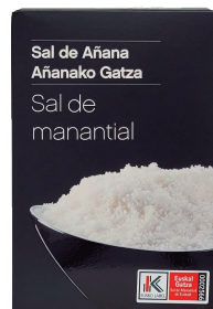
ESTUCHE 250 GR.